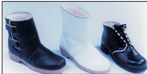
Proteção para os Pés