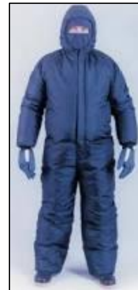
Proteção para o Corpo Todo